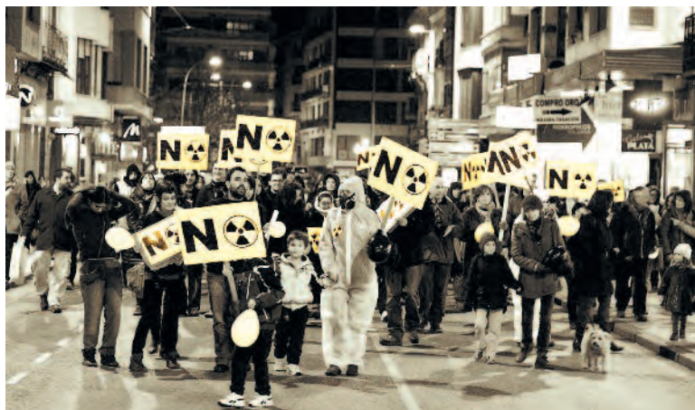
Concentración en Cuenca el 26 de enero

Estas movilizaciones ponen de nuevo en escena que no hay consenso ante una decisión, antidemocrática, que va en detrimento del desarrollo de la provincia, por ser una instalación con un alto riesgo.