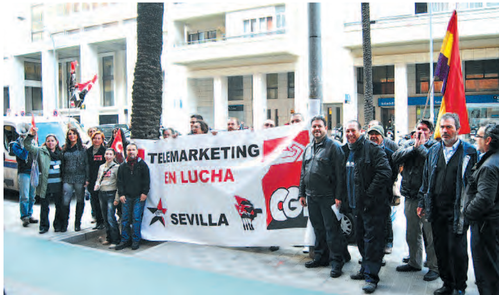
Concentración en Sevilla el 27 de enero