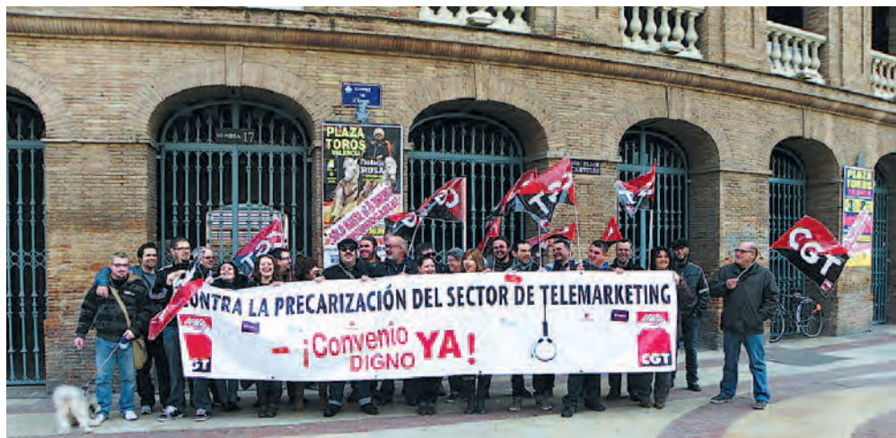
Concentración en Valencia el 12 de enero